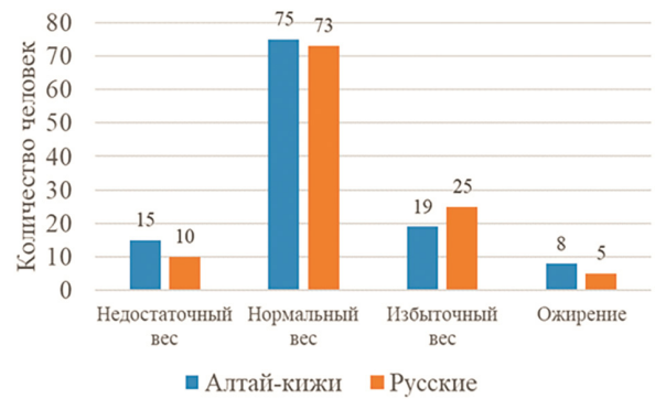
Рисунок 2. Распределение значений ИМТ в соответствии с классификацией ВОЗ в подгруппах алтайских ( n=117 ) и русских девушек ( n=113 )

Значимые различия между подгруппами алтаек и русских по компонентам соматотипа отсутствовали (табл. 3). Обе подгруппы характеризовались, в среднем, типом телосложения мезоморф-эндоморф. Распределения соматотипов в подгруппах обследованных алтаек и рус-