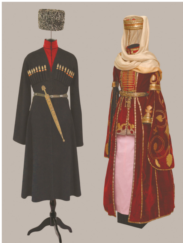
Рисунок 8. Традиционные адыгские костюмы ( https://adyg-museum.ru/upload/medialibrary/a34/Tradicion_Adyg.pdf . Дата обращения 01.03.2006) Figure 8. Traditional Adyghe costumes (Available at: ( https://adyg-museum.ru/upload/medialibrary/a34/Tradicion_Adyg.pdf . Accessed: 01.03.2006)