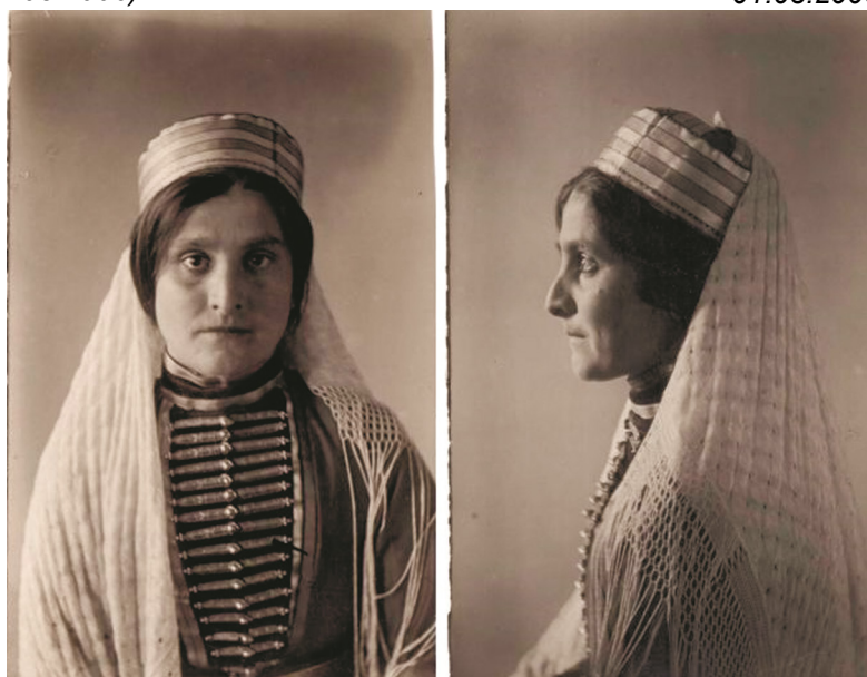
Рисунок 14. Тип черкешенки (бжедуги). Фотоколлекция Национального музея Республики Адыгея ( https://goskatalog.ru/portal/#/collections?id=25212586 ). Дата обращения 01.03.2006).